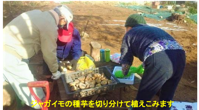
ジャガイモの種芋を切り分けて植えこみます