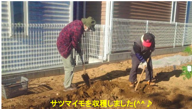
サツマイモを収穫しました(^^)♪