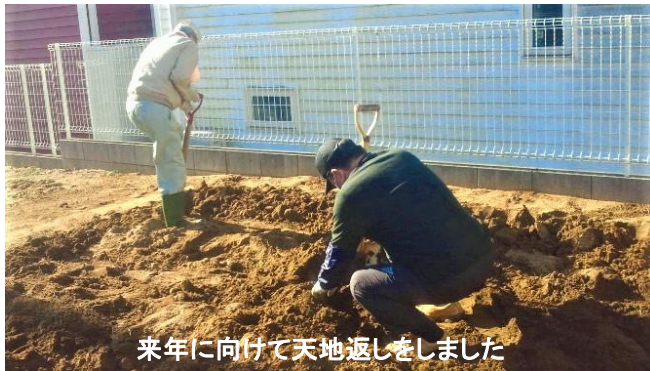
来年に向けて天地返しをしました