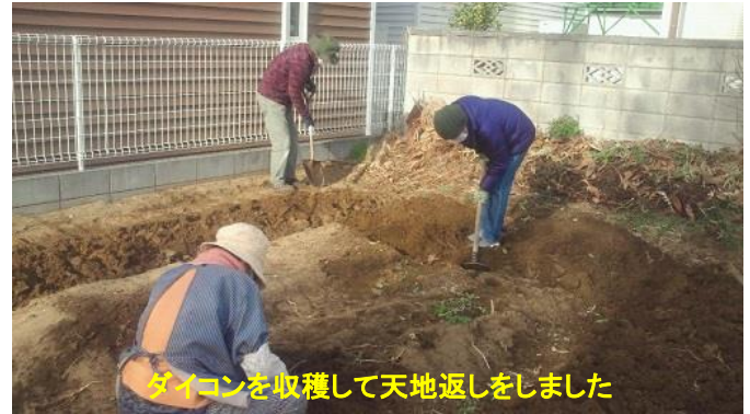
ダイコンを収穫して天地返しをしました